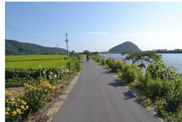
▲天気の良い日は、市内を散策するのも楽しい

http://ishinomaki-photo.blogspot.com/2013/04/newlife.html